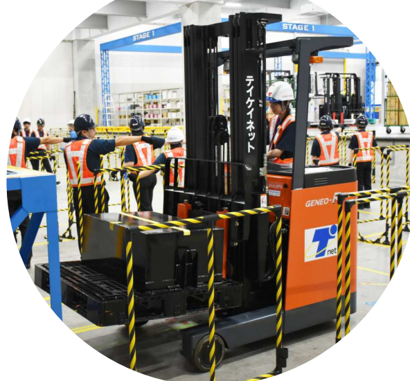
フォーク資格取得講習 1,532名