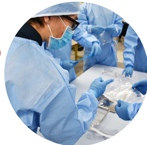
滅菌業務基礎講習 2,222名