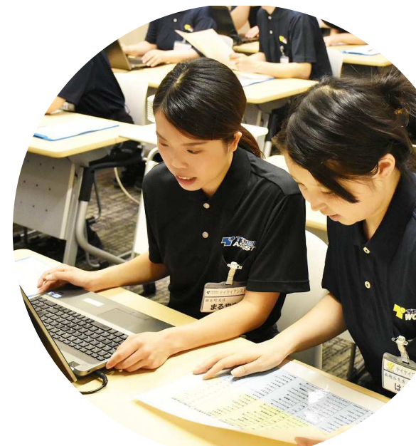
兼務事務学習会 1,086名