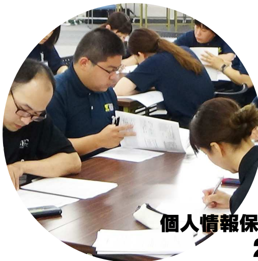
個人情報保護基礎講習 2,353名